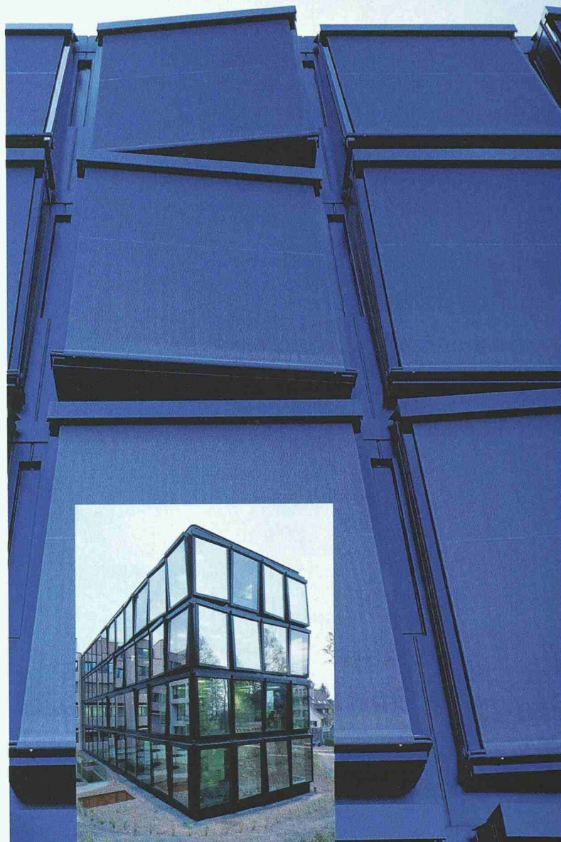
Helvetia Patria Versicherungen, St. Gallen Architekt: Herzog & de Meuron, Basel Planer: Emmer Pfenninger Partner AG, Münchenstein

Helios Ventilatoren AG · Steinackerstr. 36 · 8902 Urdorf/ZH Tel. 01/735 36 36 · Fax 01/735 36 37 www.helios.ch · E-Mail: info@helios.ch