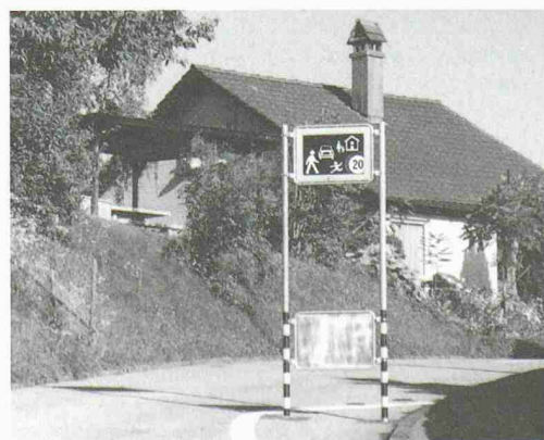
In Begegnungszonen wie hier am Löchligutweg in Bern gilt «Tempo 20», und die Fussgänger dürfen die ganze Fahrbahn benützen

Laut einer Befragung aus dem Jahr 2002 sind zwei Drittel der Anwohner der Meinung, die Wohnqualität habe mit den BGZ verbessert werden können. Bei einzelnen Zonen werden laut Tschäppät aber die Geschwindigkeitslimiten zu wenig beachtet, unter anderem, weil die Eingangstore zu wenig markant in Erscheinung treten. Bei diesen Zonen sollen nun bauliche Verbesserungen in Angriff genommen werden. Der Gemeinderat hat vor kurzem einen Kredit von 280 000 Fr. verabschiedet, zur Realisierung von 14 neuen BGZ und zur Nachbesserung bestehender Zonen. Künftig sollen zudem rund 150 000 Fr. pro Jahr eingesetzt werden, um realisierte BGZ zu sichern und neue Projekte zu bearbeiten. Tschäppät hofft, alle Projekte bis Ende 2005 realisieren zu können, ausgenommen Altstadt und Länggasse.