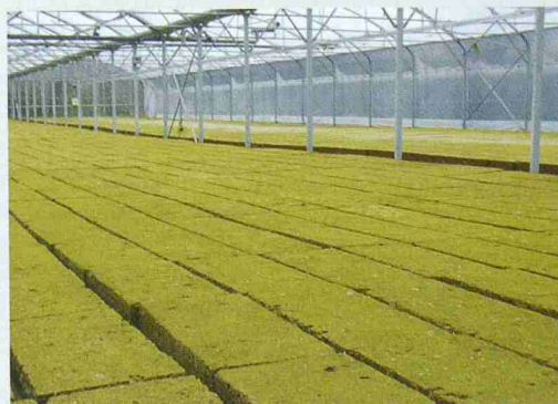
Mooskultur Bryotec, Arzal, F