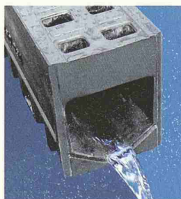
ACO DRAIN Monoblock

Wir entwickeln Lösungen gegen das Aquaplaning.