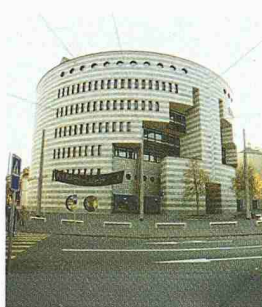
Wohn-, Gewerbe- und Industriebau

Erfolgreiche Abdichtungslösungen mit RASCOR in Bereichen wie: