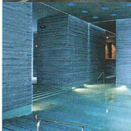
Behälter- und Bäderbau