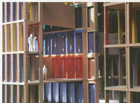
Burkard, Meyer Architekten, Baden. Schule für Berufsbildung, Baden, 2003–2006, Modellfoto