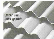
EMPA* und SUVA geprüft

DAWANIT Faserzement-Wellplatten in neuester Technologie