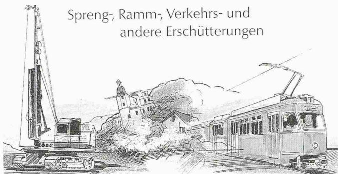
Spreng-, Ramm-, Verkehrs- und andere Erschütterungen