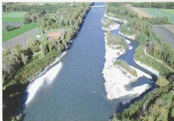
Aufweitung des Alpenrheins bei Felsberg, Chur

rischen und sicherheitstechnischen Aspekte des Flussbaus thematisiert. Die Ausstellung im Museum für Ingenieurbaukunst Hänggiturm in Ennenda GL dauert bis 25. September. Geöffnet ist samstags von 14–17 h oder nach Vereinbarung; Tel. 055 646 64 20 oder 055 640 59 56. Zur Ausstellung erschien ein Buch, ca. 140 Seiten, etwa 300 Abbildungen, broschiert, 25 Fr., ISBN 37266 00647, erhältlich beim Stäubli Verlag, Tel. 043 433 40 40.