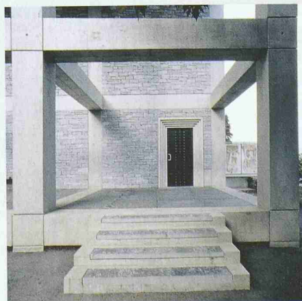
Chiesa di Porta, Brissago, von Raffaele Cavadini, 1991–1996 (Bild: GTA)

Luigi Snozzi und Raffaele Cavadini. Die neu erschienene Publikation «Raffaele Cavadini architetto. Opere dal 1987–2001» präsentiert unterschiedliche Arbeiten aus dem Tessin: Wohnhäuser, Kapellen, Museen und Platzgestaltungen (erhältlich im GTA-Verlag: Tel. 01 633 24 58 oder books@gta.arch.ethz.ch). Die Ausstellung im Architekturfoyer der ETH Hönggerberg, Zürich, dauert vom 27. 4. bis 14. 5., geöffnet jeweils Mo–Fr 8–22 h und Sa 8–12 h. Die Eröffnung findet am 26. April, 18 h, im Auditorium E3, HIL, statt.