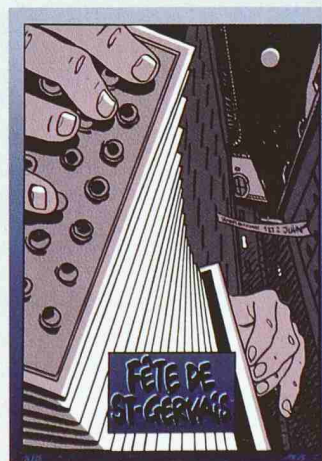
Fêtes de St-Gervais, 1985, Siebdruck von Ab'Aigre, Pascal Habegger

Museum für Gestaltung Zürich zeigt in einer Ausstellung in den Schaufenstern der Schweizerischen Nationalbank in Zürich (Fraumünsterstrasse / Stadthausquai, gegenüber Bauschänzli) Reproduktionen von Genfer Comic-Plakaten. Die Ausstellung dauert bis 15. Juli 2004. Eine bebilderte Dokumentation zur Ausstellung ist an der Portiersloge, Fraumünsterstrasse 8, erhältlich. Auskunft: Museum für Gestaltung Zürich, Tel. 043 446 67 67.