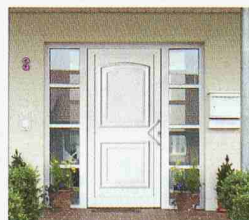
TopComfort Haustüren: über 300 Motive... Sie haben die Wahl!