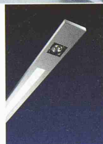
NoBody 200 INTERIOR LIGHTING / PROFILES DESIGN DELTA LIGHT

www.delta-light.ch the bright side of light