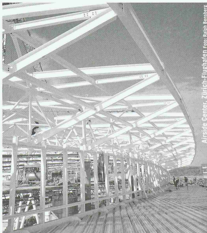
Airside Center, Zürich-Flughafen

Partner für anspruchsvolle Projekte in Stahl und Glas