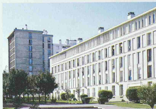
Résidence Victor-Hugo (1955–1957), Pantin, Paris, von Fernand Pouillon