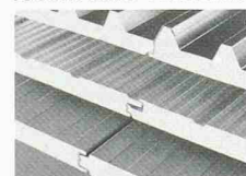
DAWATHERM Isolations-Sandwichpaneelen für rationelles Bauen