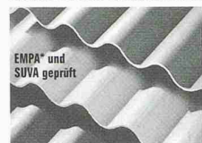
EMPA* und SUVA geprüft