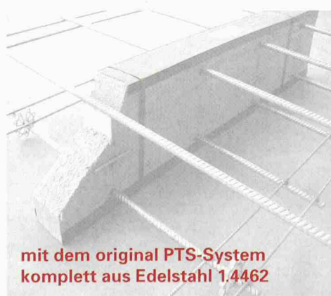
mit dem original PTS-System komplett aus Edelstahl 1.4462