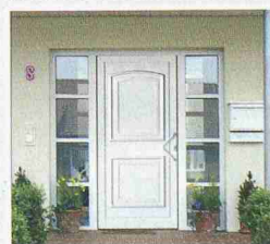
TopComfort Haustüren: über 300 Motive... Sie haben die Wahl!