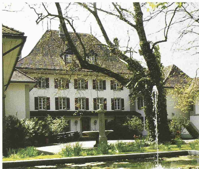
Im ruhigen Landsitz Gerzensee bei Bern bestimmte die Direktion die Schwerpunkte für das Jahr 2004