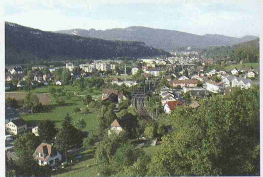
Gerade in Agglomerationslandschaften kommen auf engem Raum unterschiedliche Nutzungsansprüche zusammen (Region Aarburg / AG)

LEK bei. Die Hochschule für Technik Rapperswil (HSR) und Sanu Biel (Partner für Umweltbildung und Nachhaltigkeit) bieten die zwei LEK-Vertiefungskurse «Partizipation» (4. März) und «Öffentlichkeitsarbeit» (16. März) an. Die Kurse dauern einen Tag und können einzeln oder als Gesamtpaket besucht werden. Veranstaltungsort ist die HSR Rapperswil. Infos und Anmeldung: Sanu, Pf 3126, 2500 Biel 3, Tel. 032 322 14 33, Fax 032 322 13 20 oder per Internet: www.sanu.ch/angebot/d_aktuell.html .