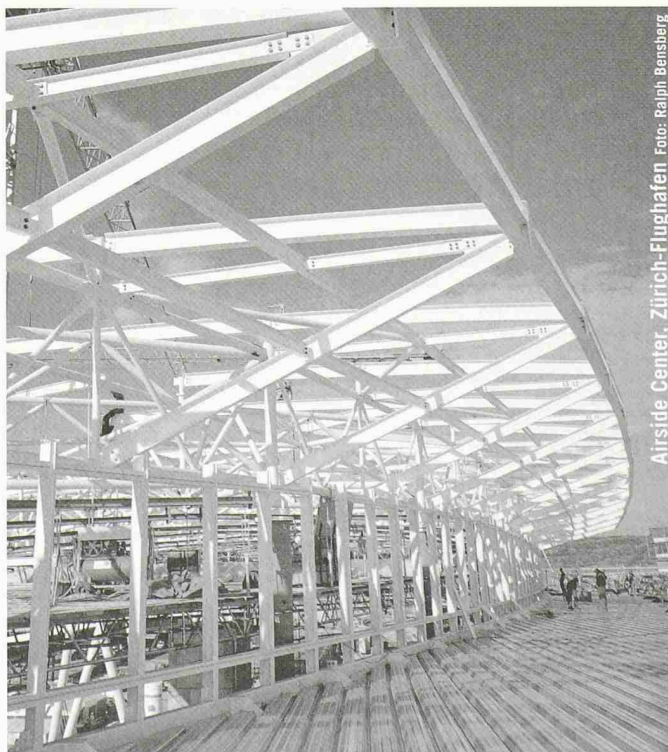
Airside Center, Zürich-Flughafen

Sie finden uns im Erdgeschoss der Halle 1, Stand C83.