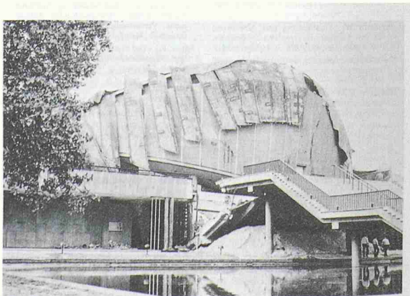
Ansicht von Südwesten