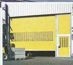
Hörmann Rolltore, jetzt auch als «Speed» Version