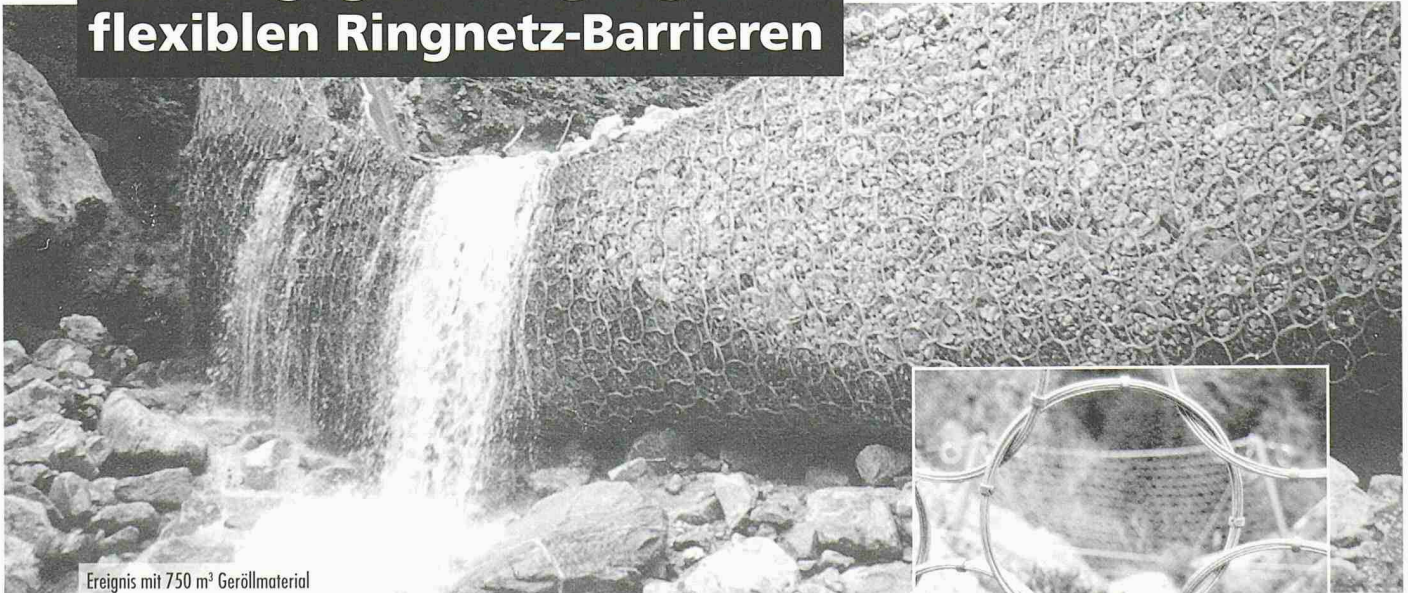
Ereignis mit 750 m 3 Geröllmaterial

Geröllmaterial von bis zu 1'000 m 3 kann durch flexible ROCCO® Ringnetz-Barrieren gestoppt werden. Ihre leichte Bauweise erlaubt eine einfache und kostengünstige Installation. Die filigranen Ringnetz-Barrieren, bemessen für dynamische Aufschläge, sind eine echte Alternative zu massiven Beton- und Stahlbauten.