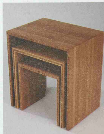
Aus der Möbelkollektion der «Gesellschaft für bessere Möbel» in Berlin, gegründet von den Architekten des Büros «213» und der Metallwerkstatt «interzone»

einem Dutzend Designerinnen und Designern vertreten. Auch die Blickfang-Modeschauen geben sich international: Zehn Designer aus Helsinki, Paris, Wien und Zürich zeigen ihre neuen Kollektionen. Die Messe findet vom 19. bis 21. November im Kongresshaus Zürich statt und ist am Freitag und Samstag von 12 bis 22 h sowie am Sonntag von 11 bis 19 h geöffnet. Am Freitag um 19 h vergibt eine Fachjury die Auszeichnungen «Blickfang» in Gold, Silber und Bronze. Weitere Infos: www.blickfang.ch oder +49 711 99 09 30.