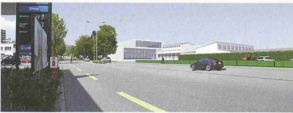
Der Werkhof aus Betonelementen (1. Rang, Gebert Architekten und Strässler + Storck Architekten)