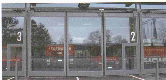
Wälty & Co. AG Die Tormanufaktur seit 1848 CH-5040 Schöftland/Aarau