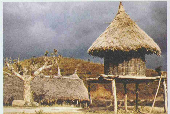
Die Ausstellung in München zeigt die verschiedenen Bau- und Kulturformen Äthiopiens

Anfang des 20. Jahrhunderts entdeckt wurde. Die von der Bayerischen Architektenkammer und dem Staatlichen Museum für Völkerkunde konzipierte Ausstellung vom 5.11. bis 17.12. im Haus der Architektur in München lässt anhand von Tafeln, Plänen, Zeichnungen, Texten, Bildern und Alltagsgegenständen die verschiedenen Regionen und Volksstämme mit ihren teils expressiven, teils zurückhaltenden Architekturen lebendig werden. Infos: Haus der Architektur, Waisenhausstrasse 4, München, Tel. +49 89 139 88 00, www.byak.de.