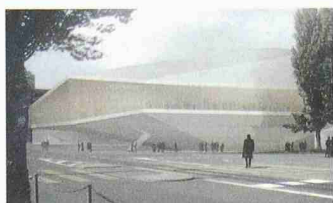
Das Ufo mit zusätzlichen Mantelnutzungen (Dietrich / Untertrifaller und Schöttli mit Halter)