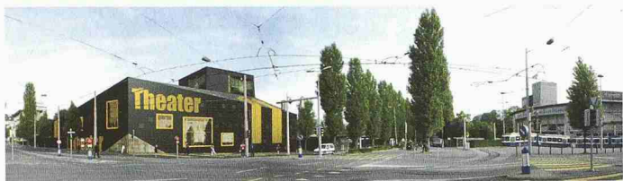
Umgestaltung und Erweiterung des Musicaltheaters (Zur Weiterbearbeitung empfohlen, EM2N Architekten mit Bauengineering)