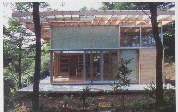
Kazunari Sakamoto, Hütte T, 2001. Kleines Landhaus nahe des Yamanaka-Sees, Yamanashi

und Nachfolger von Kazuo Shinohara am Tokyo Institute of Technology erforscht seit 35 Jahren das scheinbar Selbstverständliche. Schönheit im Alltäglichen zu entdecken ist ein zentrales Thema buddhistischer Ästhetik. Sakamotos Wohnhäuser sind vielschichtige Gebilde, die sich gängigen ästhetischen Vorstellungen widersetzen. Die Gebäude sind pragmatisch und zugleich mit hoher Genauigkeit geplant. Zur Ausstellung erschien ein Katalog. Infos: +49 89 289 22 493 oder www.architekturmuseum.de .