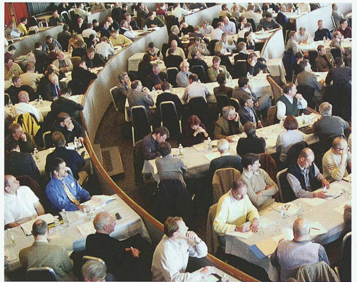
Die Einführungskurse in die neuen Tragwerksnormen des SIA erfreuten sich grosser Nachfrage. Aufnahme von der Einführungsveranstaltung