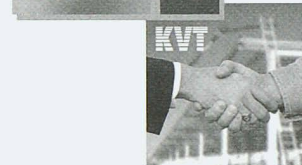
Befestigungstechnik von Profis für Profis

Profitieren auch Sie von dieser neuen Technik. Gerne senden wir Ihnen Gratismuster.