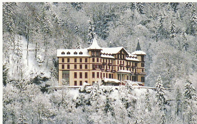
Gäste dank Geschichte: Im originalen Zustand erhaltene Hotels haben heute mehr Erfolg als andere. Das Hotel Giessbach am Brienzersee ist Historisches Hotel des Jahres 2004