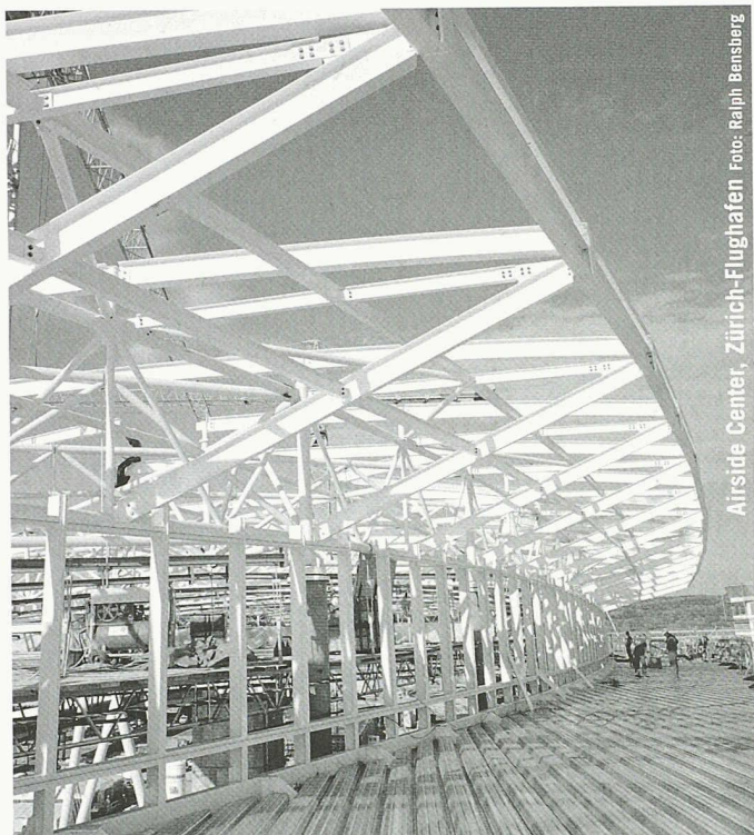
Airside Center, Zürich-Flughafen

Partner für anspruchsvolle Projekte in Stahl und Glas