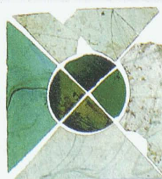
Fragmente farbiger Ornamentfenster und klarer Fensterverglasungen aus karolingischer Zeit, Münstair

wecken. An über 100 Orten in der Schweiz finden Führungen, Atelier- und Baustellenbesichtigungen, Exkursionen und weitere Veranstaltungen statt. Dabei kann Glas in allen Formen erlebt werden: Glasmalereien des Mittelalters, Glas aus archäologischen Fundstätten, als Werkstoff oder auch als moderne Glasarchitektur. Informationen zu den Veranstaltungen: www.hereinspaziert.ch