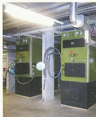
Die Holzschnitzelheizung des Nahwärmeverbunds Grenchen spart 66 000 Liter Öl

Als Generalplaner begleiteten Roschi und Partner das Projekt. Der Bund unterstützte das Vorhaben mit einem Lothar-Beitrag von 190 000 Franken. Die Stadt Grenchen bewilligte einen Kredit von 590 000 Franken. Die Realisierung hat 565 000 Franken gekostet.