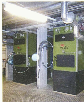
Die Holz-schnitzelheizung des Nahwärmeverbunds Grenchen spart 66 000 Liter Öl

Als Generalplaner begleiteten Roschi und Partner das Projekt. Der Bund unterstützte das Vorhaben mit einem Lothar-Beitrag von 190 000 Franken. Die Stadt Grenchen bewilligte einen Kredit von 590 000 Franken. Die Realisierung hat 565 000 Franken gekostet.