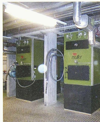
Die Holz-schnitzelheizung des Nahwärmeverbunds Grenchen spart 66 000 Liter Öl

Als Generalplaner begleiteten Roschi und Partner das Projekt. Der Bund unterstützte das Vorhaben mit einem Lothar-Beitrag von 190 000 Franken. Die Stadt Grenchen bewilligte einen Kredit von 590 000 Franken. Die Realisierung hat 565 000 Franken gekostet.