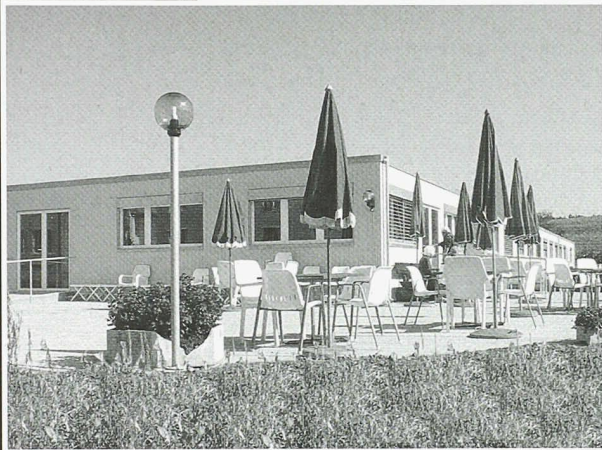
Alterswohnheim Klotten (Architekt: Thomet Bauleitungen)

Scheifele Container AG • Vorfabrizierte Bauten Unterdorfstrasse 21 • 8114 Dänikon Tel. 01 844 34 40 • Fax 01 844 34 74 container@scheifele.com • www.scheifele.com ISO 9001:2000 zertifiziert