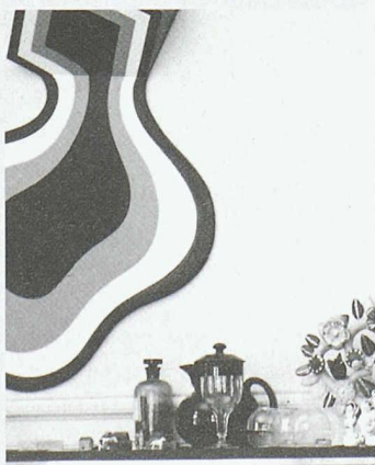
Wohnungseinrichtung von Familie Berger, Januar 1968