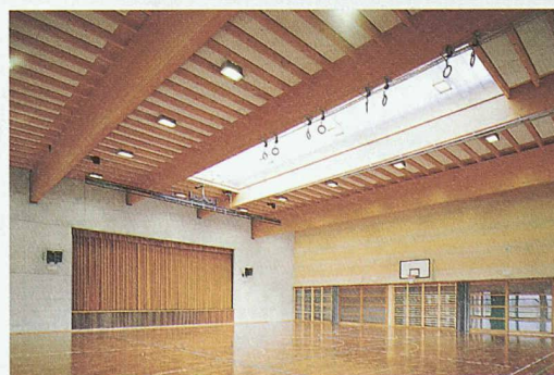
Der Fortbildungskurs Norm SIA 265 ist speziell auf Tragwerksplaner zugeschnitten. Oben: Gemeindezentrum Avusy, Athenaz (Baujahr 2001). Architekten: Carlo Steffen & Gérald Berlie, Carouge

kungen auf Tragwerke (Norm SIA 261) behandelt. Die Fortbildungskurse bilden so für alle Bauingenieure den idealen Einstieg in die neuen Normen respektive in die Holzbauplanung. Der Kurs besteht aus zwölf Lektionen, die sich auf drei Abende oder 1½ Tage verteilen. Als Kursunterlage wird eine umfassende Beispielsammlung abgegeben. Auskunft und Anmeldung: Hochschule für Architektur, Bau und Holz Biel, 032 344 03 18, claudia.stucki@swood.bfh.ch, oder unter www.lignum.ch, Funktion/Veranstaltungen/Weiterbildung.