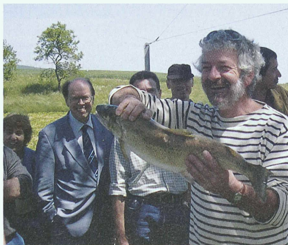
Ein Prachtsexemplar einer Forelle als Beweis für die erfolgreichen Renaturalisierungsmassnahmen am Arnon