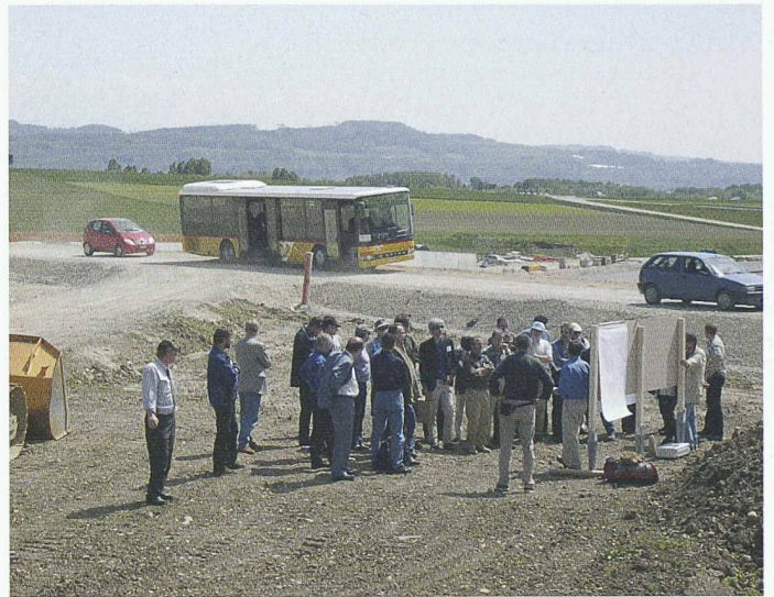
Wo in der Umgebung von Onnens heute noch offene Wunden klaffen, soll der einst ein traditioneller Baumgarten mit alten Hochstammsorten wachsen

Diese Autobahn führt durch eine schöne, landwirtschaftlich intensiv genutzte, alte Kulturlandschaft und durchschneidet Gebiete mit einer reichen Pflanzen- und Tierwelt. Ihr Bau ist ein grosser und bleibender Eingriff. Ein solcher Verkehrsweg trennt unbarmherzig die Pflanzenwelt sowie die lokalen Verkehrsnetze der Bewohner und der Tiere, die die Landschaft wie Spinnennetze überziehen. Aus den Erfahrungen früher erstellter Autobahnteilstücke haben Behörden und Planer gelernt, wie sie die Beeinträchtigungen verringern können.