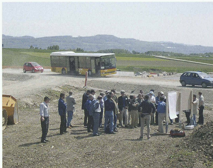
Wo in der Umgebung von Onnens heute noch offene Wunden klaffen, soll der einst ein traditioneller Baumgarten mit alten Hochstammsorten wachsen

Diese Autobahn führt durch eine schöne, landwirtschaftlich intensiv genutzte, alte Kulturlandschaft und durchschneidet Gebiete mit einer reichen Pflanzen- und Tierwelt. Ihr Bau ist ein grosser und bleibender Eingriff. Ein solcher Verkehrsweg trennt unbarmherzig die Pflanzenwelt sowie die lokalen Verkehrsnetze der Bewohner und der Tiere, die die Landschaft wie Spinnennetze überziehen. Aus den Erfahrungen früher erstellter Autobahnteilstücke haben Behörden und Planer gelernt, wie sie die Beeinträchtigungen verringern können.