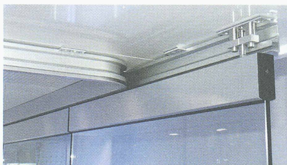
Der durchdachte Parkraum eröffnet neue Gestaltungsmöglichkeiten.

Lassen Sie sich ausführliche Unterlagen schicken.