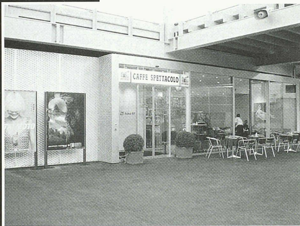
Caffe Spettacolo HB Zürich (Architekt: Pool Architekten Zürich)

Scheifele Container AG • Vorfabrizierte Bauten Unterdorfstrasse 21 • 8114 Dänikon Tel. 01 844 34 40 • Fax 01 844 34 74 container@scheifele.com • www.scheifele.com ISO 9001:2000 zertifiziert