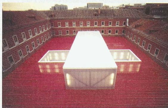
Zeitgleich mit der Ausstellung kann im Innenhof des Kulturzentrums Conde Duque in Madrid der realisierte Ausstellungspavillon von 2b architectes besichtigt werden

Das Architekturmuseum in Basel hat zusammen mit spanischen Veranstaltern fünf junge Architekturbüros eingeladen, einen temporären Pavillon im Hof des Kulturzentrums Conde Duque zu entwerfen. Die Arbeiten der fünf Architekturbüros 2b architectes, Lausanne; Baumann und Roserens, Zürich; Buzzi und Buzzi, Locarno; Conradin Clavuot, Chur, sowie sabarchitekten, Basel, sind nun im Architekturmuseum ausgestellt (bis 31.8.). Am 23.8. findet in der Ausstellung ein Gespräch mit den fünf am Wettbewerb beteiligten Architekturbüros statt, zudem werden diverse Führungen angeboten. Öffnungszeiten: Di–Fr 13–18 h, Sa 10–16 h, So 13–16 h. Infos: Tel. 061 261 14 13 oder www.architekturmuseum.ch .