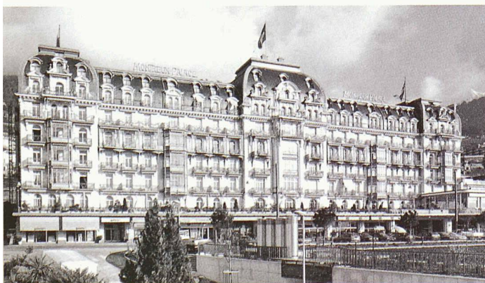
Hotel «Montreux-Palace», Prunkstück aus der Belle Epoque, dem goldenen Zeitalter des Tourismus. Die 250-Betten-Burg wurde 1904–06 vom Lausanner Architekt Eugène Jost in nur 22 Monaten gebaut