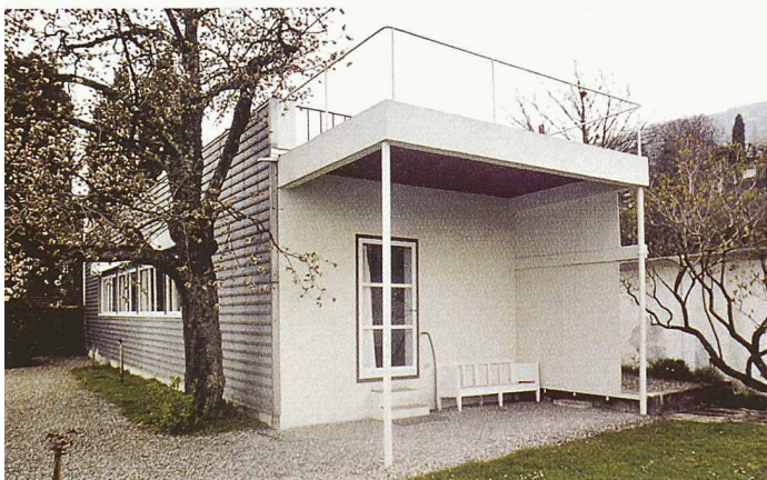
Die Villa Le Lac in Corseaux bei Vevey, die Le Corbusier 1922/23 für seine Eltern baute. Die «Schachtel auf dem Boden» (Le Corbusier) ist nur 2,50 m hoch und 60 m 2 gross

(rw/pd) In der vom Schweizer Heimatschutz lancierten Reihe «Baukultur entdecken» ist die dritte Broschüre erschienen. Das Faltblatt stellt 21 Bauzeugen in der Region Montreux - Vevey vor und ist wie schon bei Arosa und Mürren sorgfältig recherchiert und ansprechend gestaltet. Der Rundgang führt zu herrschaftlichen Anwesen aus dem 18. Jh., Hotelpalästen der Belle Epoque, Villen von Le Corbusier und Adolf Loos und zu Hochhäusern und Konzernsitzen der Nachkriegsmoderne. Gratis bei: Schweizer Heimatschutz, Postfach, 8032 Zürich, www.heimatschutz.ch