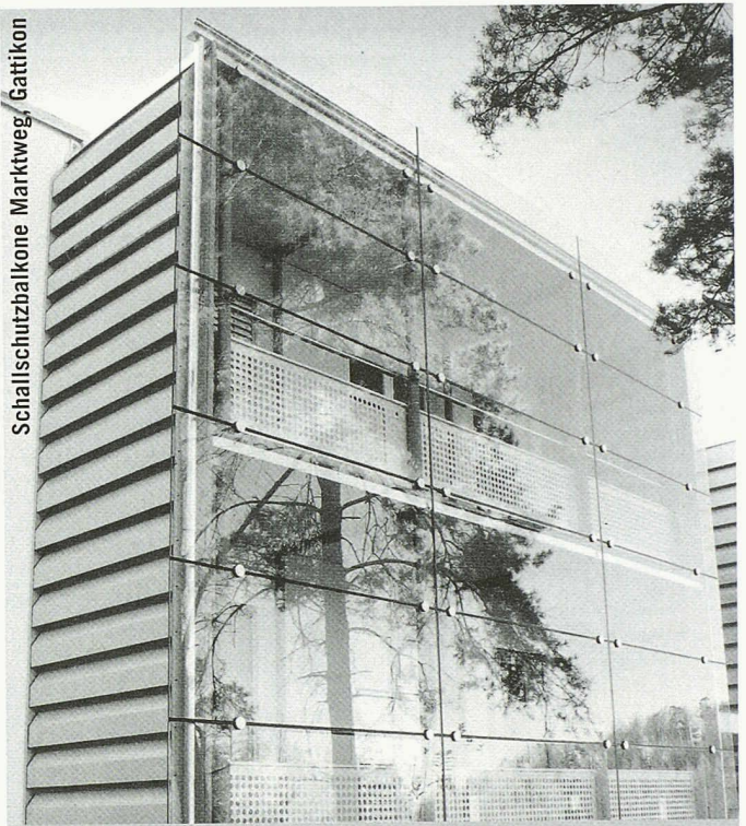
Schallschutzhaikone Marktweg, Gattikon

Partner für anspruchsvolle Projekte in Stahl und Glas