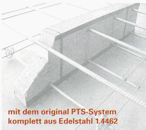
mit dem original PTS-System komplett aus Edelstahl 1.4462