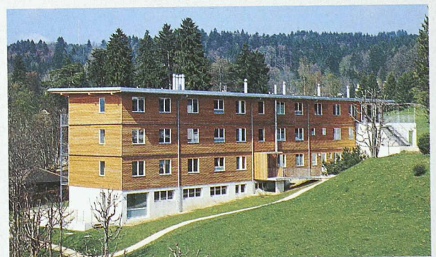
Am 6. Mai veranstaltet die Schweizerische Hochschule für die Holzwirtschaft ein Seminar zum Thema Qualität im Holzhausbau. Im Bild: Wohnhaus Bois-Gentil, La Chaux-de-Fonds; Architektur: Charles-Eric Chabloz, Antoine Chabloz, La Chaux-de-Fonds; Holzbau: Häring & Co., Pratteln

die Seminarteilnehmer weiter. Die Tagungsschwerpunkte sind: Die heiklen Punkte im Holzbau: wie werden typische Mängel im Holzhausbau vermieden; die Qualitätssicherung im Holzhausbau im internationalen Vergleich; die prozessorientierte Qualitätssicherung in der Planung, Herstellung und Montage; konstruktiv richtig – architektonisch attraktiv; Unterhalts- und Serviceleistungen sowie Beispiele und Erfahrungsaustausch. Begleitet wird die Tagung durch eine Ausstellung. Informationen und Anmeldung: Claudia Stucki, Schweiz. Hochschule für die Holzwirtschaft, Tel. 032 344 03 18, Mail: sic@swood.bfh.ch oder www.swood.bfh.ch.