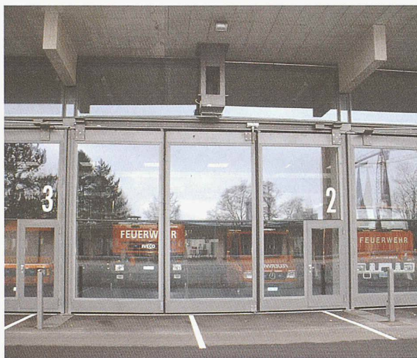
grösste verglaste Falttortflügel Europas

Darf es auch einmal ein schönes Tor sein ?