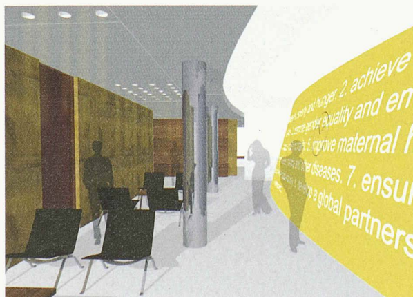
Das Geschenk der Schweiz ist ein elegantes Interieur mit grauem Wollteppich, Walnussholz und schwarzem Leder