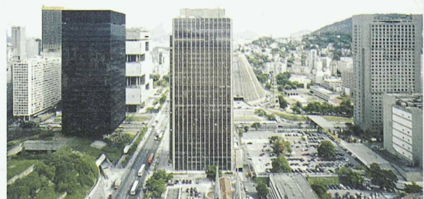
Bild von Tobias Madörin, Centro do Rio de Janeiro, 2002 (Ausschnitt)

seine Bilder dokumentieren die widersprüchlichen Lebensbedingungen in den Megacities: Fussballstadien, öffentliche Schwimmbäder oder das Sambadromo und gleichzeitig Favelas, Müllberge oder einen Friedhof für ausgediente Bohrtürme. Die Ausstellung dauert vom 27.2.–19.4. und ist jeweils geöffnet Di–Fr 12.15–18.15 h und Sa 11–16 h. Weitere Infos: www.architekturforum-zuerich.ch oder Tel. 01 252 92 95.